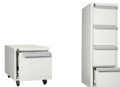
Modell Hurts AV10