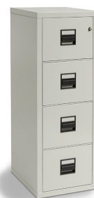
Modell FK 4-22