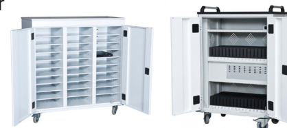
Laptopvagn 231 Vagn för surfplattor

DS 232: Utv. H: 1050 B: 750 D: 450 || Dagöppning, fack: H:85 B: 340 D: 485